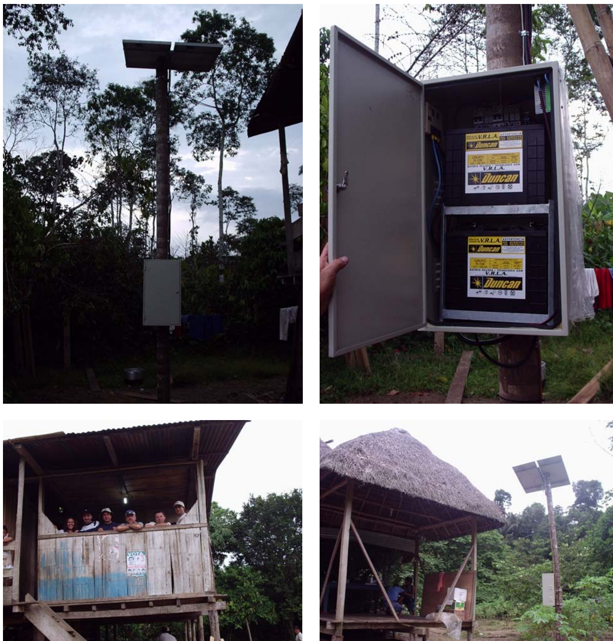
Fotografía 1. Sistemas fotovoltaicos residenciales instalados en el Proyecto Arajuno.

de Sarayacu las viviendas estén rodeadas de ellos. Algunas de las viviendas son chozas sin paredes y con techos muy pronunciados contruidos con hojas. Es común que los niños se movilicen o gateen en estas viviendas y cualquier instalación eléctrica interior podía poner en peligro sus vidas, especialmente por las baterías. Los SFVR debían ser instalados con estas restricciones y además considerar el aspecto de propiedad, ya que los SFVR son de propiedad de la Empresa Eléctrica Ambato, y no se pueden instalar al interior de una vivienda. Se resolvió entonces montar los SFVR fuera de en un poste de 5 a 6 metros según lo muestra la fotografía y los componentes dentro de un gabinete metálico resistente a la corrosión y a los rayos ultravioletas.